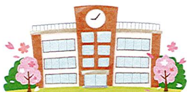
浦和大里小 1~4年校舎