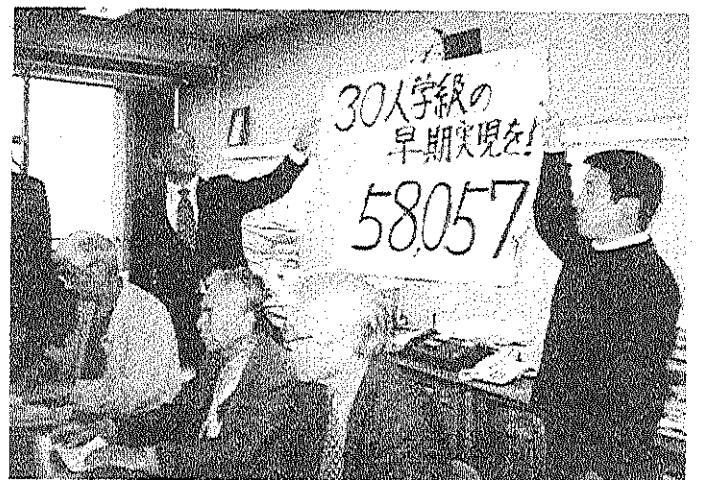
▲11月26日 30人学級実施を求める 請願書の議会への提出